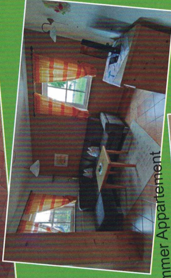
2-Zimmer Appartement Erdgeschoss